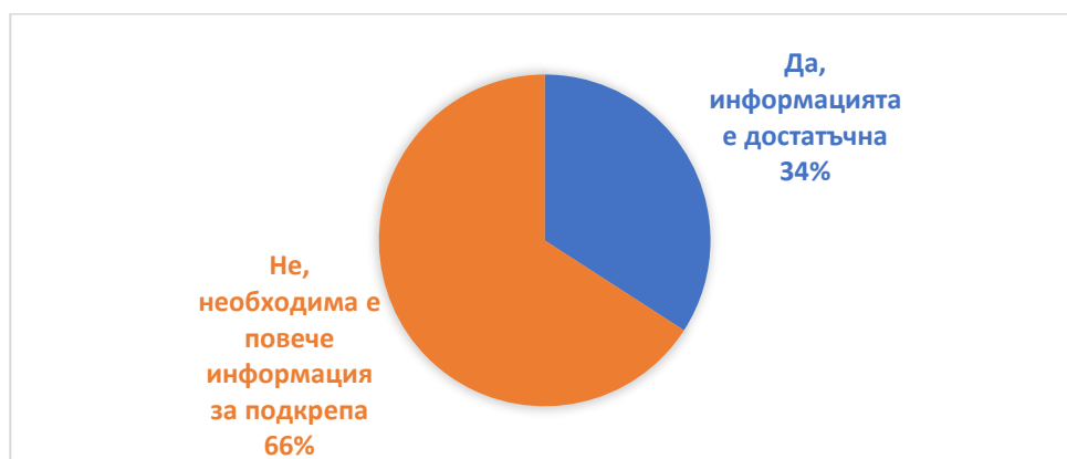
Фиг.1. Относителен дял на отговорите на въпрос №1