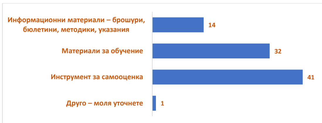
Фиг.4. Разпределение на отговорите на въпрос №4