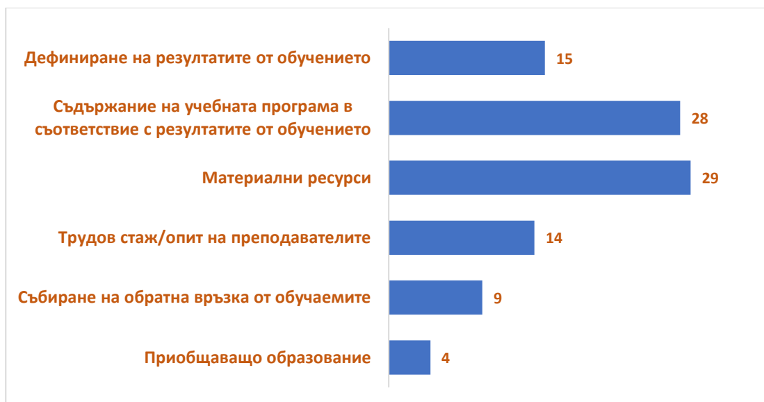
Фиг.2. Разпределение на отговорите на въпрос №2