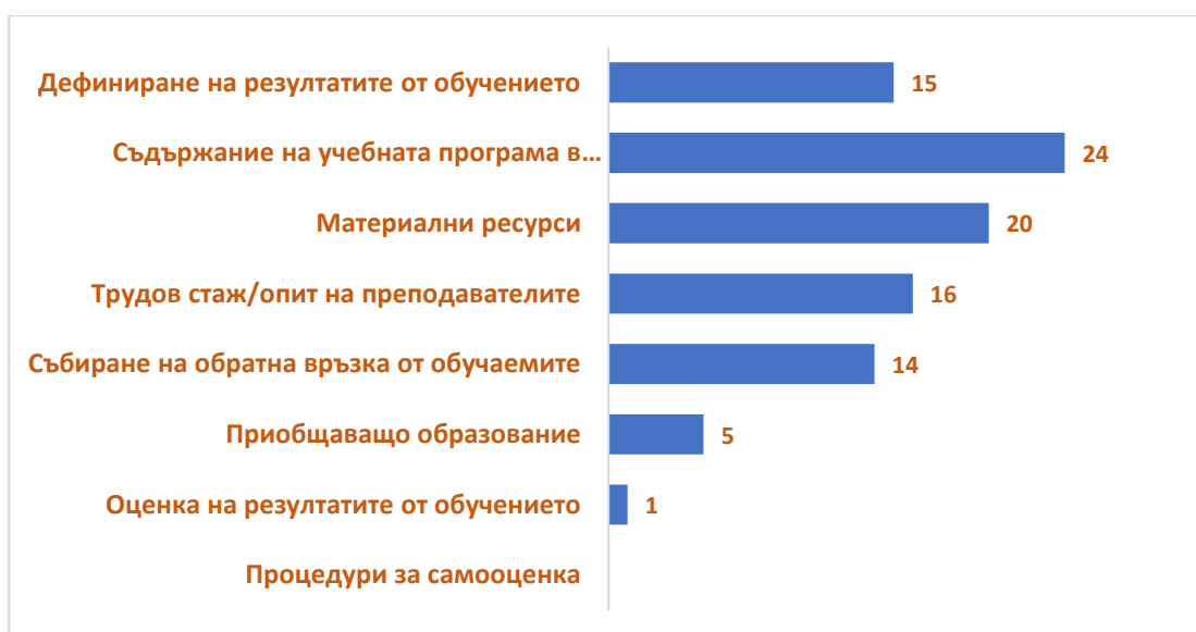
Фиг.3. Разпределение на отговорите на въпрос №3